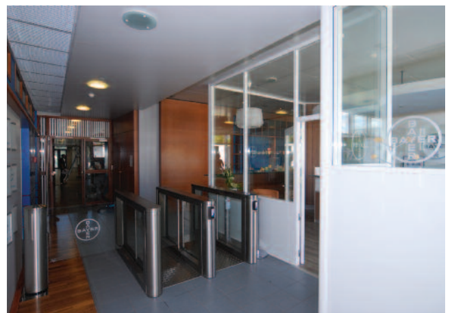
Gestion d'accès au site – Portiques