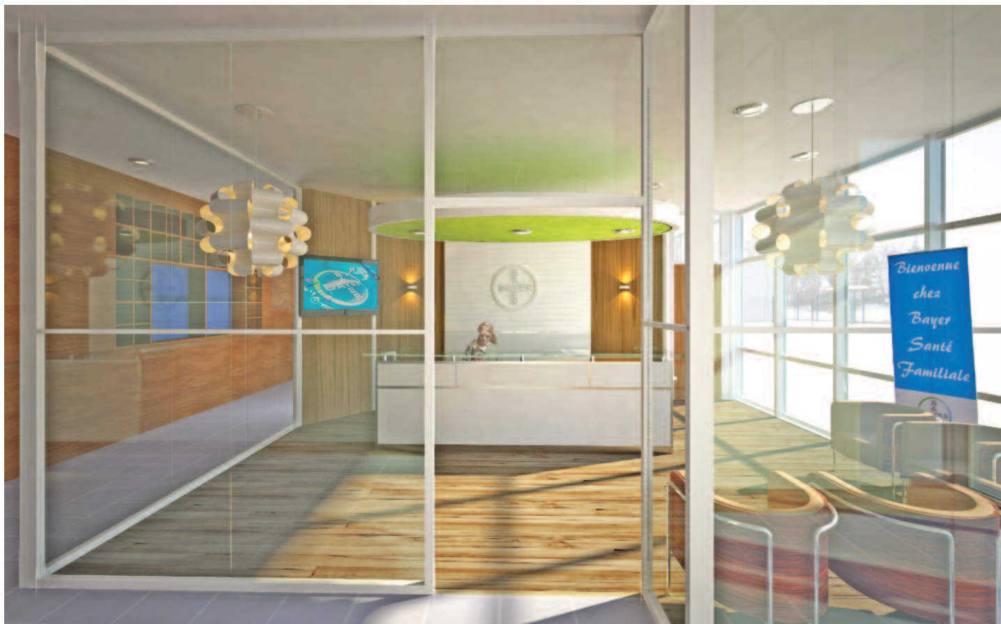
Accueil en 3D